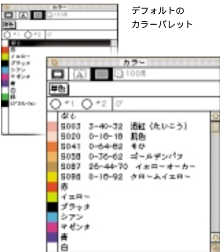
デフォルトの カラーパレット

実物の色見本帖で色を選定し、アソシエのドキュメントの中の色コマを自分のドキュメントにドラッグ&ドロップするだけで、すぐに使用できます。